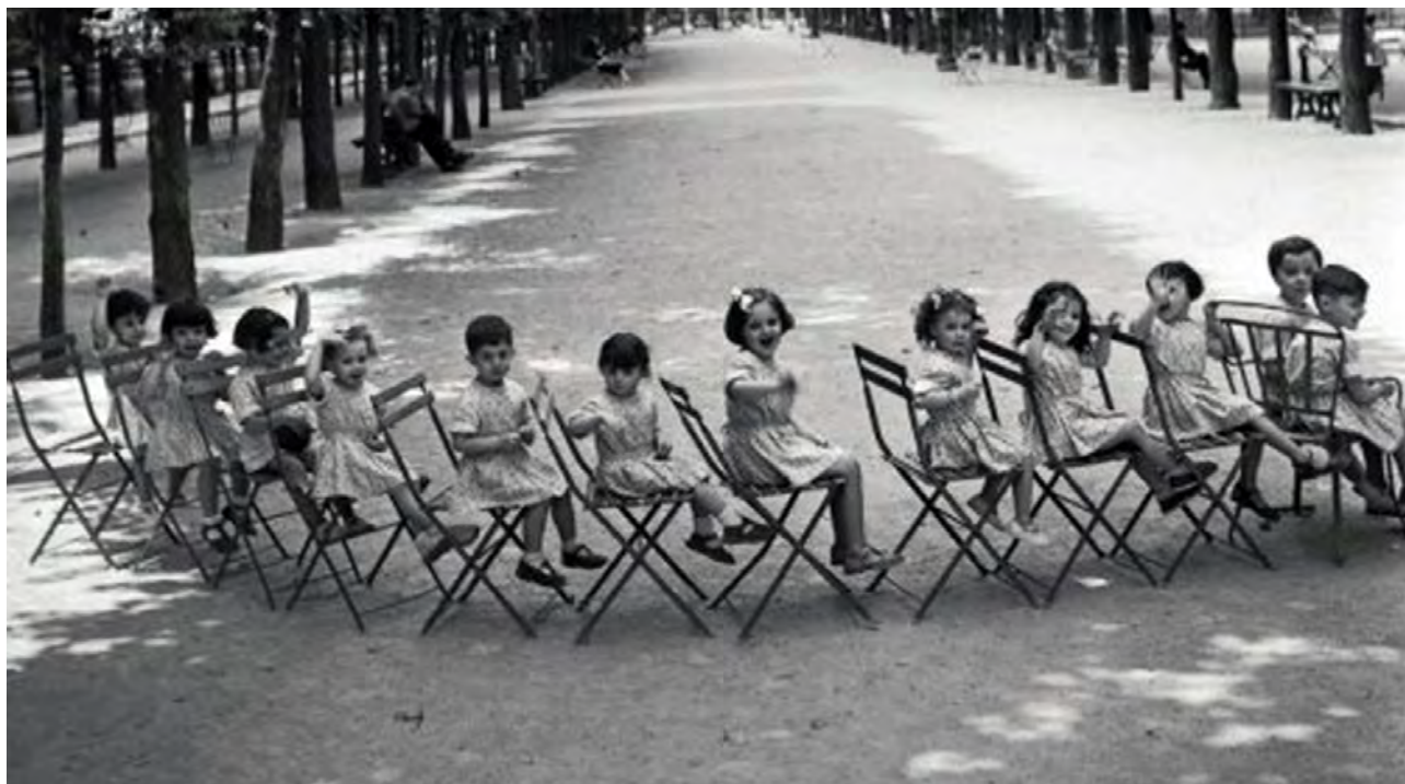
Robert Doisneau, 1951