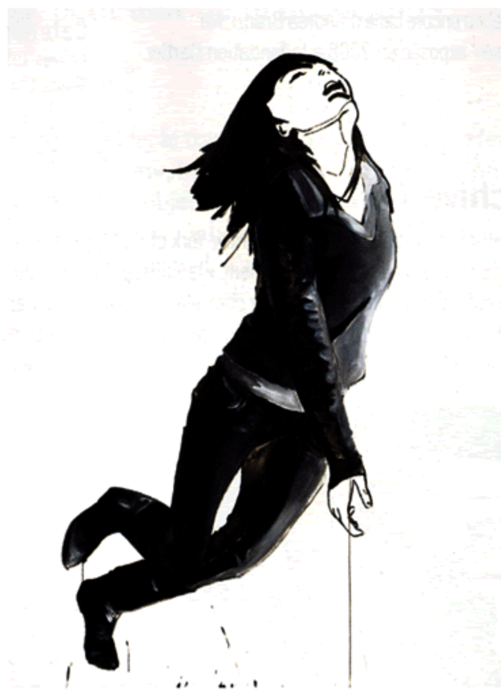
À gauche EDITH DEKYNDT One Second of Silence, part 2 (NY) 2008, vidéo, 18 min. 29 sec. Galerie Les Filles du calvaire, Paris/Bruxelles.

Actuellement exposée au Witte de With de Rotterdam, puis dans sa galerie parisienne à partir du 20 mars, l'artiste a été sélectionnée parmi les 23 solo-shows de la foire.