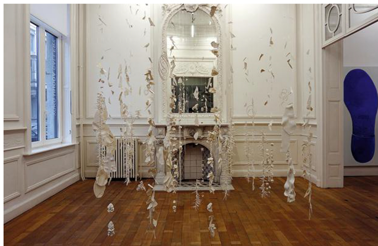
(à gauche) Djos Janssens, "Cherry Smile", acrylique sur toile, 100 x 90 cm. (à droite) Charlotte Beaudry, "Climax", porcelaines, dimensions variables, installation dans la galerie, 2016 – 2017.